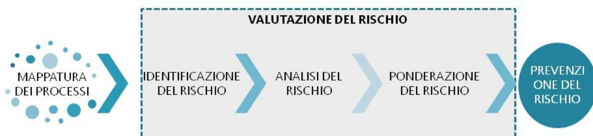
Figura 1- processo di valutazione del rischio nell'Azienda Speciale Farmacie Comunali Sedriano

All'interno delle Aree di rischio individuate sono stati mappati i processi e procedimenti che l'azienda pone in essere e, per ognuno di questi, sono stati ipotizzati i possibili eventi di corruzione.